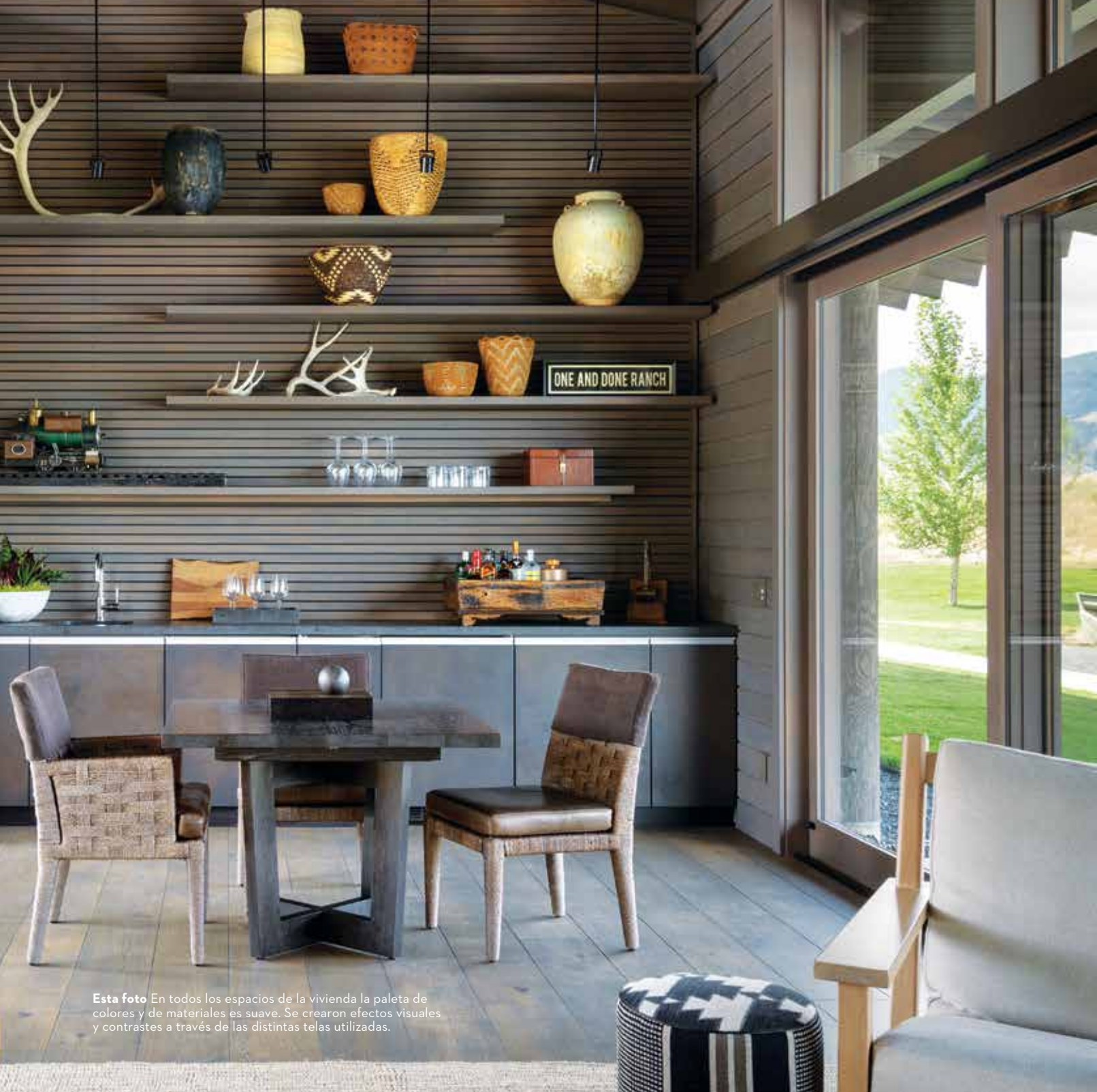
Esta foto En todos los espacios de la vivienda la paleta de colores y de materiales es suave. Se crearon efectos visuales y contrastes a través de las distintas telas utilizadas.