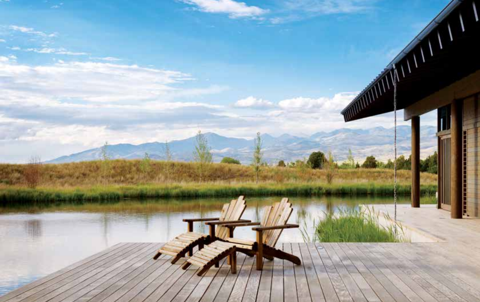
Arriba Las sillas Adirondack son de Tom the Irishman. Los dos estanques de esta propiedad fueron realizados por Miller Recreational Development. Abajo El equipo de Suyama Peterson Deguchi diseñó las lámparas de papel con un marco de acero negro de Landbridge Lighting. La isla de la cocina es de Montana Tile & Stone. Las sillas son de Christian Grevstad y los taburetes de Blackman Cruz (Los Angeles).